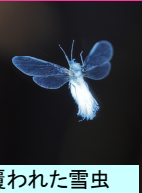
綿毛で覆われた雪虫

知ってるようで知らない雪虫について、とても神秘的な感じがする雪虫、実はアブラムシの一種でトドノネオオワタムシと言います。