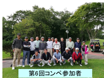
第6回コンペ参加者

会員の皆様、楽しい会ですのでゴルフ好きな方は上手い下手関係なく参加をお勧めいたします。